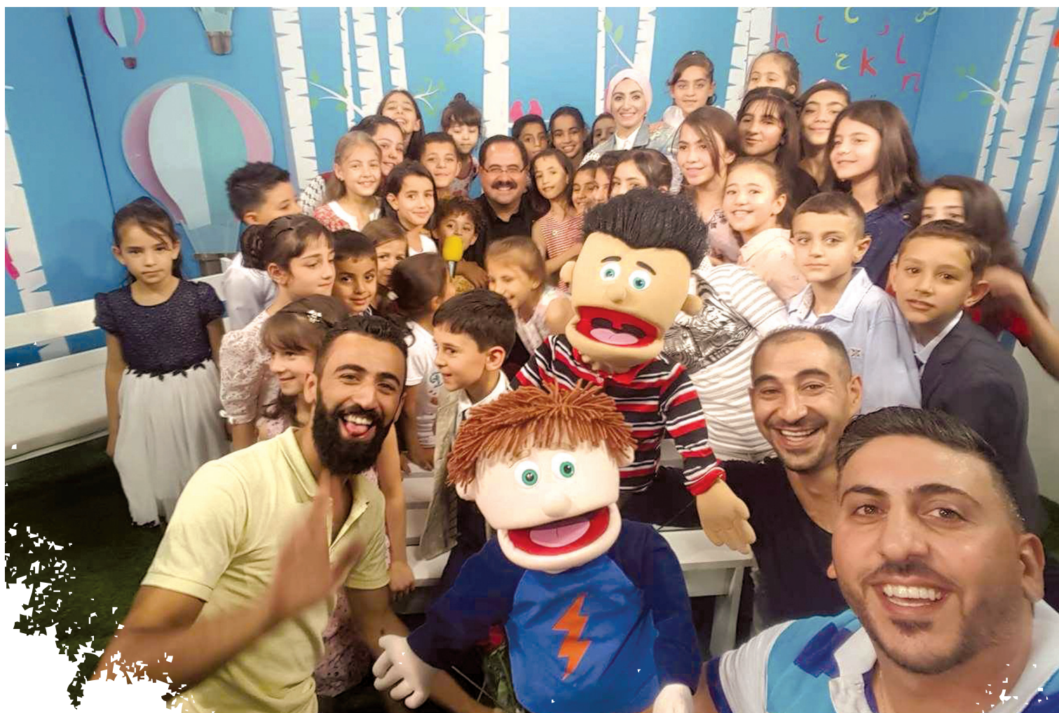
VELLYKKET Et skoleprogram som har til hensikt å redusere vold i skolen, har vist seg å være svært vellykket. Derfor vil myndighetene at det skal implementeres i hele landet. På bildet besøker utdanningsministeren, Dr. Sabri Saidam, prosjektets TV-show. Ministeren er mannen med bart og briller, som står blant barna i bakgrunnen.

Nr 6. 28. juni 2017 Årgang 135 Organ for Den Evangelisk Lutherske Frikirke