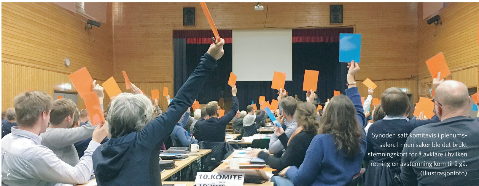
Synoden satt komitevis i plenumsalen. I noen saker ble det brukt stemningskort for å avklare i hvilken retning en avstemning kom til å gå. (Illustrasjonfoto)

under Misjonsressurser. Der ligger også utfyllende informasjon om arbeidet det samles inn til, samt videosnutter om aksjonen. I tillegg er det utarbeidet et opplegg for fire adventssamlinger til tro i hjemmet. Disse er tilgjengelig på samme side, og de passer fint å kombinere med bøssa. - Vi håper mange vil være med og