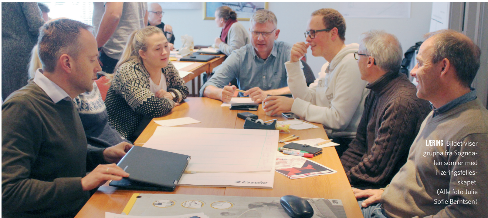
LÆRING Bildet viser gruppa fra Sogndalen som er med i læringsfellesskapet.

beid mest i hvor mye av midlene som skal fordeles til prosjekter i tråd med vedtatte strategier kontra til mindre menigheter som trenger støtte i sin daglige drift over tid. - Det ble presisert i debatten at det kan søkes om støtte for inntil fem år av gangen. I de reviderte retningslinjene står det også å lese at hovedkontoret og FriBU normalt ikke kan søke om støtte fra utviklings-