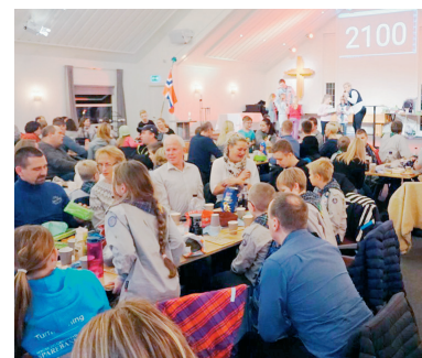
GØY Festen fant sted i Songdalen Frikirke. Lotteriet i bakgrunnen.