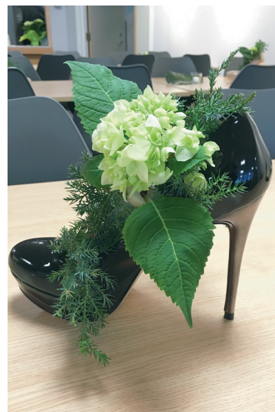
PYNT Tøffe blomsteroppsatser preget bor- dene i kaféen.