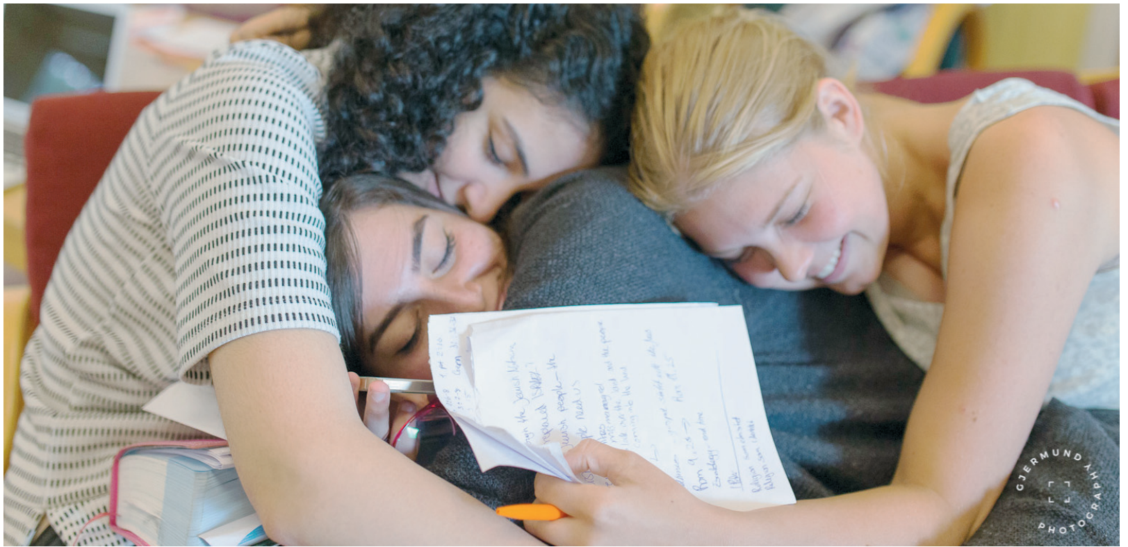
( Illustrasjonsfoto fra BridgeBuilders som er omtalt side 13.)