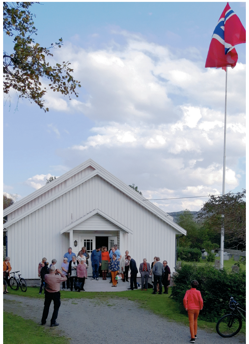
JUBILEUM Menighetslokalet i Rødøy ble pusset opp for fem år siden.