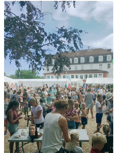
TUNET Visjons naturlige møtepunkt. (Foto: Budbæreren arkiv).

Promoteringen av festivalen starter i februar. Da kommer det flyere og plakater, og Visjons nettside (frikir-