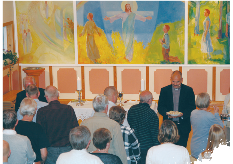
(Illustrasjonsfoto fra Brunlanes Frikirke under et Arbeidermøte)

Jeg er glad at denne måten å feire nattverd på er endret, og at vi nå har et inkluderende fellesskapsmåltid i nattverden, der alle som tror, også barn, får delta. Det er så deilig befriende med barn som kommer fram til nattverden nettopp som barn. Mange ganger og mange steder har jeg sett barna som blir hentet fra søndagsskole og inn til nattverd, og har kjent gleden når de komme løpende, dansende, ivrige... Og jeg vet at det ofte ikke er foreldrene eller oss voksne som bestemmer at de må komme, de ønsker det, de vil være med på dette. De synes det er fint å få være en del av fellesskapet som får vin (eller saft) og brød, får høre at dette er Jesu kropp og blod. De kommer gjerne