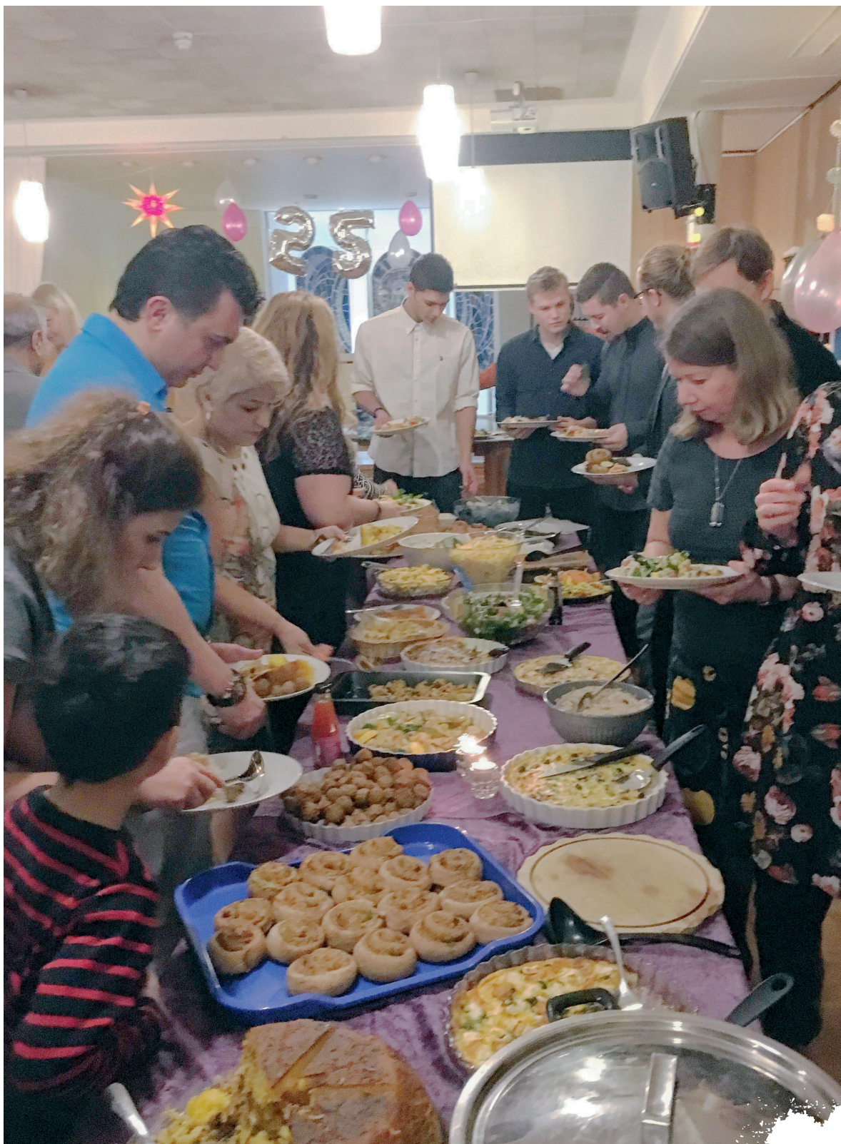
FESTBORD Til 25-årsfeiringen tok alle med seg egen rett til felles bord.