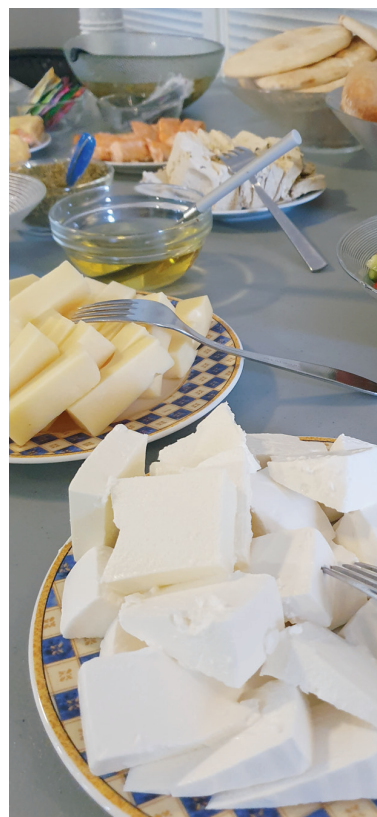
VARIERT Gjestene på misjonsfrokosten får prøve smaker fra flere land og kulturer.