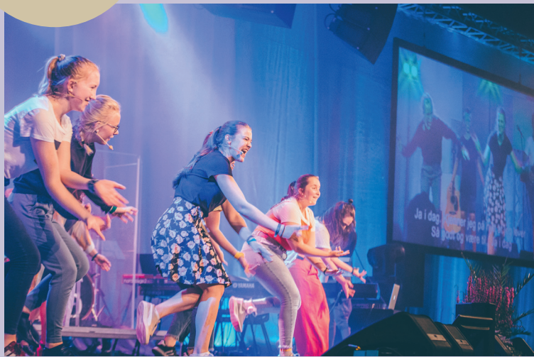
HITS Familiesamlingen Hits for Alle er en kjent og kjær tradisjon på Visjonsfestivalen. (Foto: Kristian Ringen).