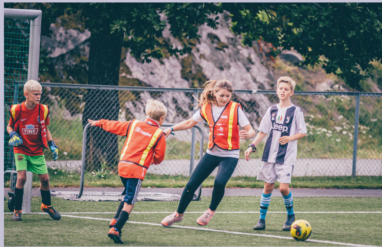
PÅ BANEN Ingen UngVisjon uten fotball! Her får alle som vil være med og boltre seg.