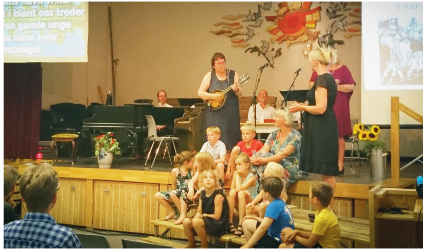
JUBILEUM På lørdagskvelden var det jubileumsfest i gymsalen der barna (og resten) kunne bli med på søndagsskolesanger fra mange år tilbake.