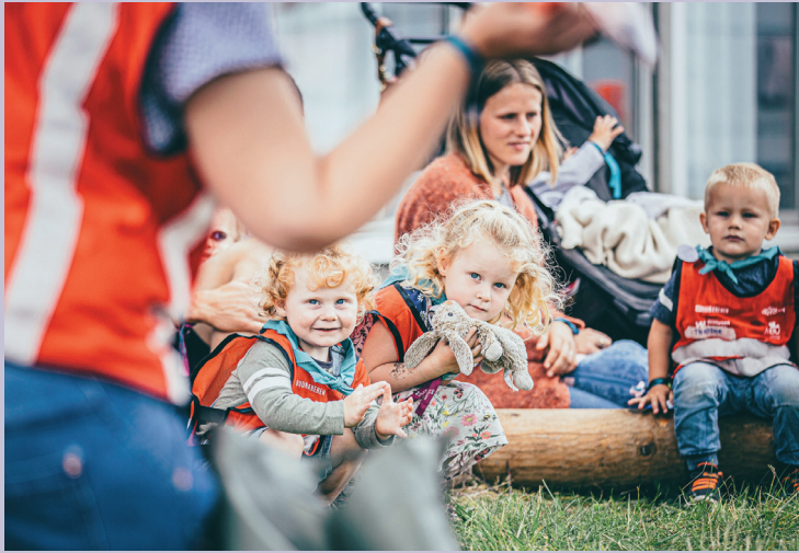
STAS Det er mange aktiviteter å velge blant på UngVisjon, også for de aller minste.