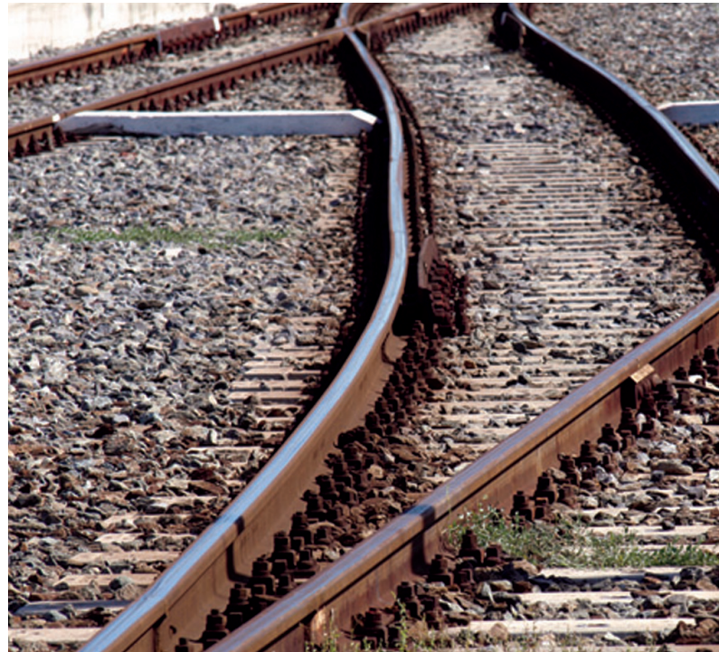
KLIMATILTAK Nye retningslinjer for tjenestereiser i Frikirken legger opp til å kutte antall flyreiser med minst åtte prosent årlig frem mot 2030. Tog eller buss skal benyttes der det er mulig.

Beregninger av Norges rettfærdige andel for å nå Paris-avtalens klimamål, slår fast at Norge må redusere klimagassutslipp med minst femtittre prosent innen 2030 («Norway's fair share», Kirkens Nødhjelp 2014). Det er naturlig at Frikirken følger denne anbefalingen, heter det i de nye retningslinjene som gjelder fra 1. januar 2020 og som skal evalueres og revideres første kvartal 2021.