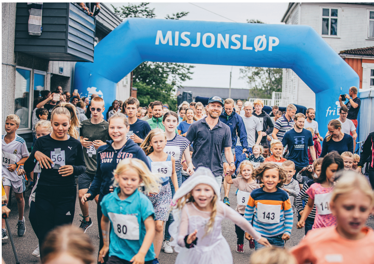
FRAMTIDEN Med glede og den største iver stormer barn og unge fram for å samle inn mest mulig penger til misjon på Frikirkens sommerfestival Visjon.

Nr 1. 11. februar 2010 Årgang 138 Organ for Den Evangelisk Lutherske Frikirke