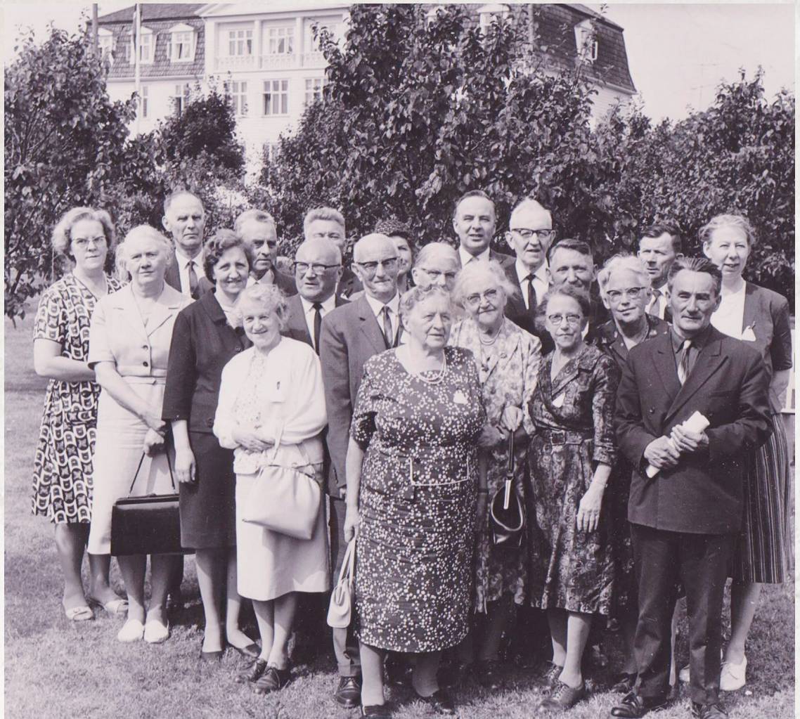
MISJON Finnmarksmisjonenes arbeidere fotografert på Fredtun i Stavern i 1967.

Egentlig skulle det være nok å si at vi er til for slike som er glad i Jesus!