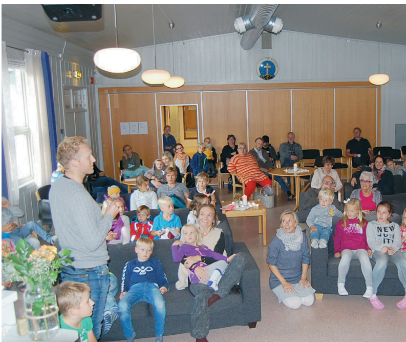
SAMHØRIGHET Små og store fra Stavern Frikirke var samlet på Solåsen leirsted.

Helga 23.-25 september var femti barn i alderen 0-10 år og like mange voksne sammen på Solåsen leirsted.