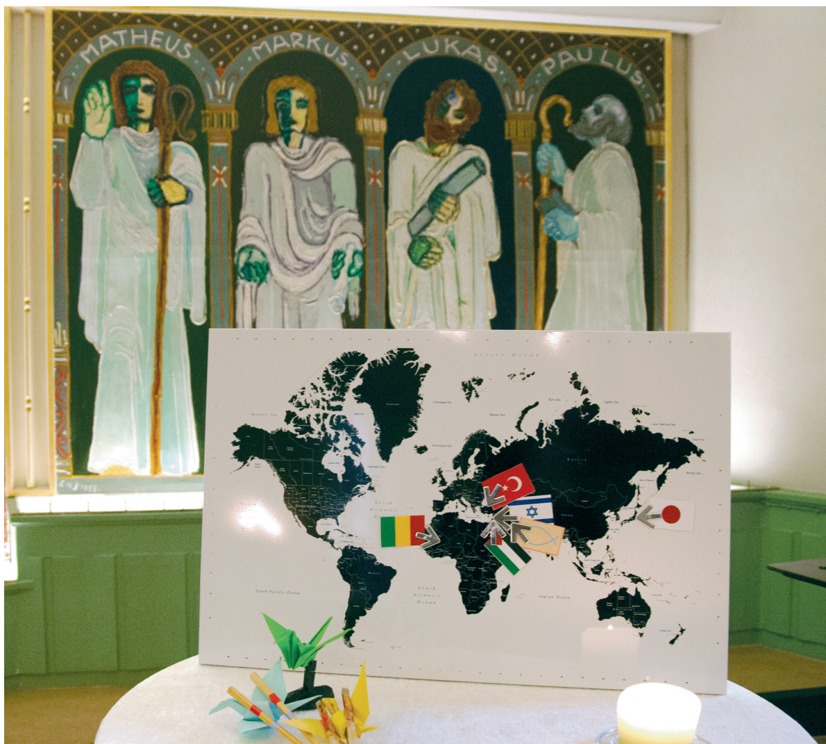
ØSTRE Oslo Østre Frikirke hadde jubileumsgudstjeneste og misjonslotteri på kirkekaffen. De ulike aktivitetene i jubileumsåret har gitt 110 000 kroner til misjon, fra denne enkeltmenigheten.