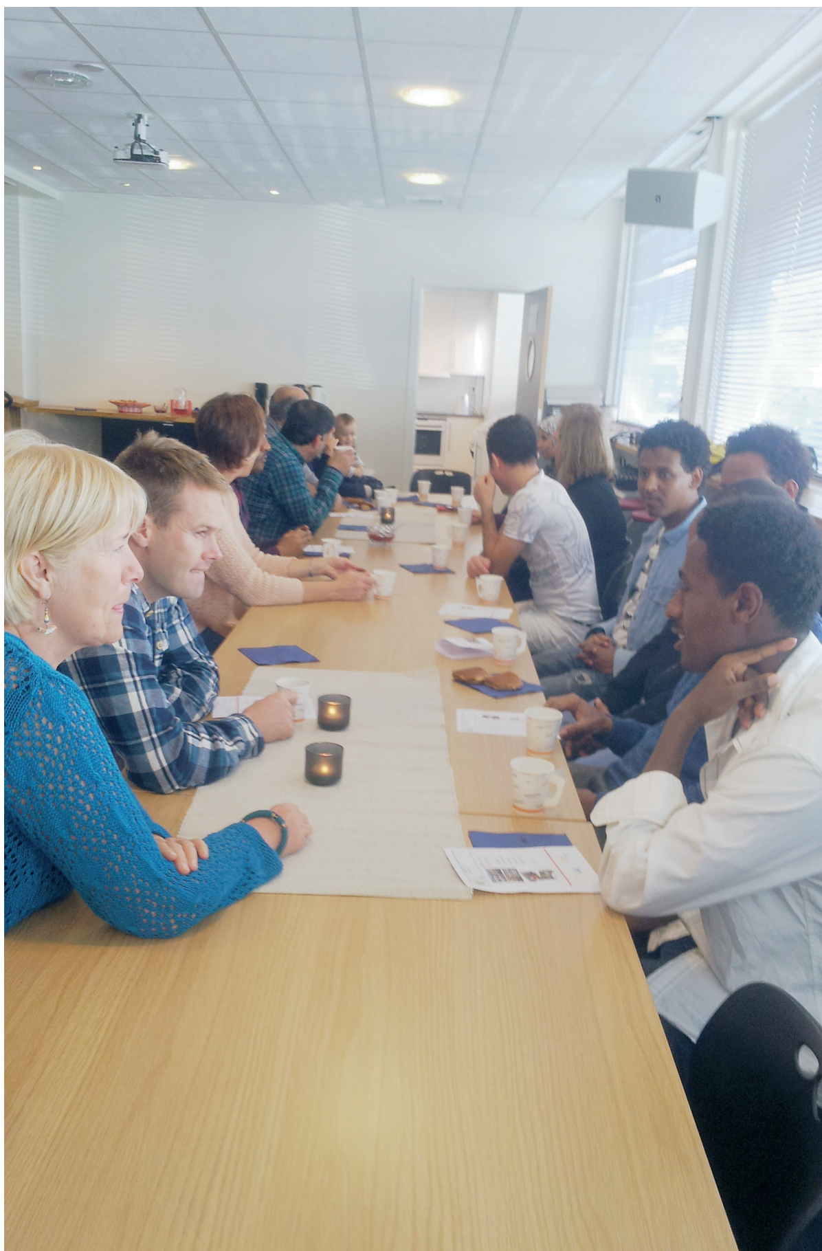
MÅLTID Felleskap rundt et bord er en god måte å møtes.

Budbæreren vil sette søkelys framover på menigheters møter med innvandrere.