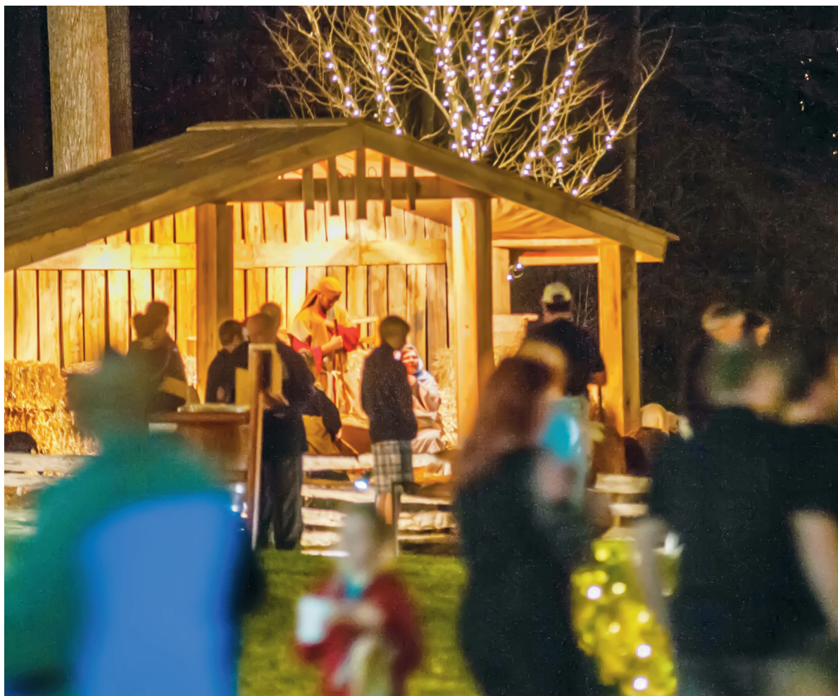
ADVENT Førjulstiden er for mange forbundet med mas og stress, la heller tiden bli en tid for å finne hjem og åpne hjem.