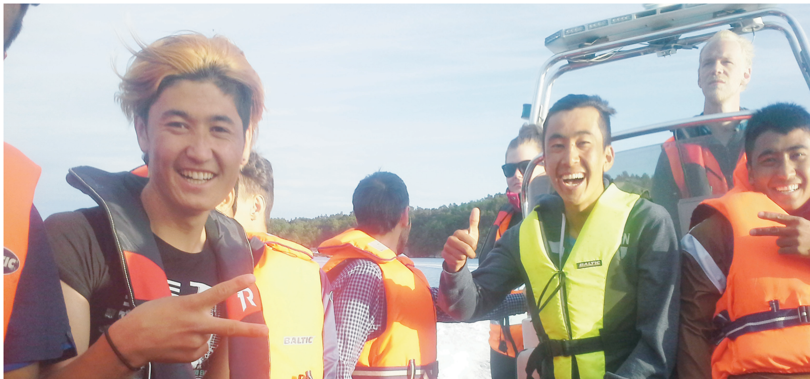
UTFLUKT Gjennom «Aktiv Fritid» kan ungdommer delta i ulike aktiviteter. Her fra en båttur i mai i fjor.